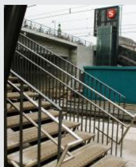
Trappetrin / Treppenstufen / Stair steps