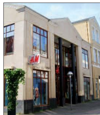
Specialopgaver / Sonderprojekte / Special Projects