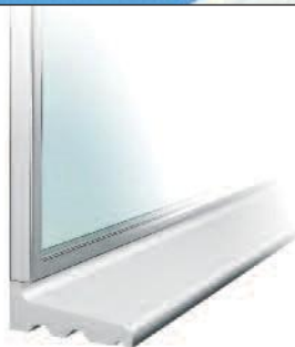
Sålbænke / Sohlbänke / Window Sills