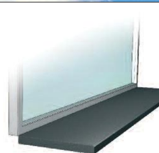
Vinduesplader / Fensterbänke / Indoor Window sills