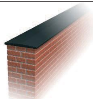
Murafdækninger / Mauerabdeckungen / Wall Copings