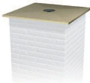
Skorstensafdækninger / Schornsteinabdeckungen / Chimney plates