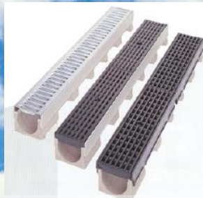
Afløbsrender til professionelle / Linienentwässerung / Line surface draining