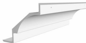
Gesimser / Gesimse /Cornices