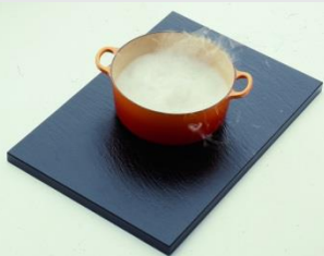
Varmefaste bordplader / Wärmebeständige Platten / Heat resistant kitchen plates