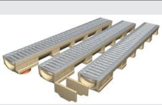
Afløbsrender til "gør det selv" / Do it your self Entwässerung / Do it yourself Drainage